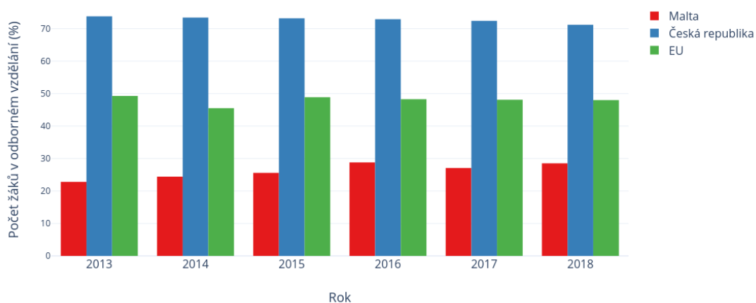
Obrázek 1.3: Porovnání procentuálního zastoupení žáků na odborném vzdělání mezi Maltou a Českou republikou. Data převzata z [4]

Po ukončení povinné školní docházky, zamíří na Maltě výrazně větší část na školy poskytující všeobecné vzdělání. V roce 2018 studovalo odborné školy 28,5 % ze všech žáků zapsaných do vyššího sekundárního vzdělání. Jak je vidět z Obrázku 1.3 toto číslo v průběhu minulých let mírně roste, i tak zdaleka nedosahuje hodnoty v České republice, která drží v Evropské unii prvenství. Průměr Evropské unie dosahoval v roce 2018 48 %. [4]